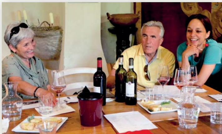
Chianti wine tour